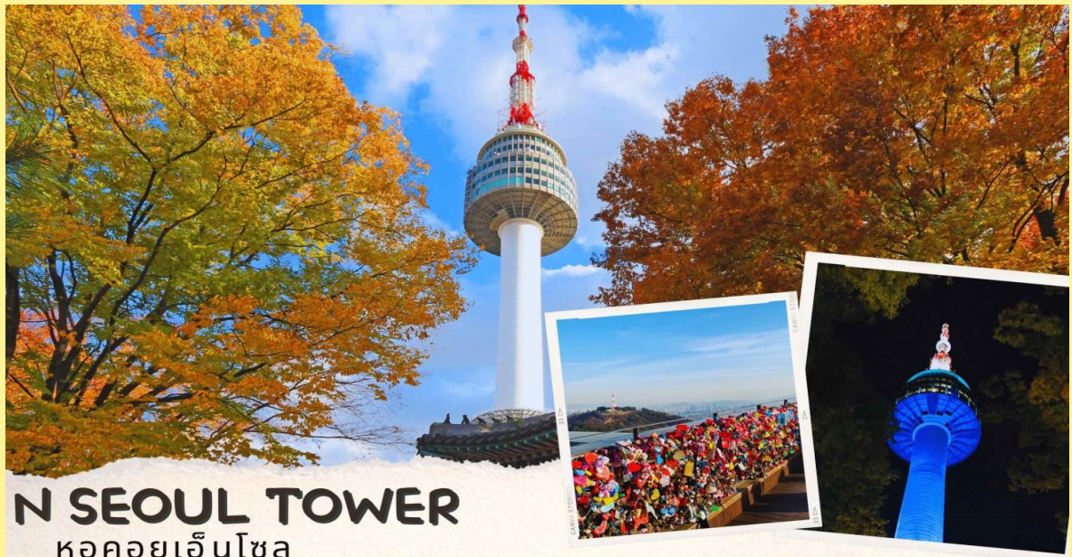
N SEOUL TOWER หอคอยเอ็นโซล

จากนั้นนำท่านไปที่ Seaweed Museum พิพิธภัณฑ์สาหร่ายโซงฮัก เป็นพิพิธภัณฑ์ที่ผลิตและแสดงการเลี้ยงสาหร่ายแบบครบวงจร ซึ่งทางการท่องเที่ยวของประเทศเกาหลีอนุญาตให้นักท่องเที่ยวสามารถเข้าไปเยี่ยมชม และเลือกซื้อสาหร่ายพร้อมทั้งทดลองชิมได้ตามอัธยาศัย นำท่านไปเรียนรู้วิธีการทำ คิมบับ(ข้าวห่อสาหร่าย) อาหารง่ายๆที่คนเกาหลีนิยมรับประทานโดยการนำข้าวสุกและส่วนผสมอื่นๆหลากชนิด เช่น แดงกวา แครอท ผักโขม ไข่เจียว ปูอัด เป็นต้น แล้วแต่วัตถุดิบที่ท่านสะดวก วางแผ่นบนแผ่นสาหร่ายแล้วม้วนเป็นแท่งยาวๆ จากนั้นหั่นเป็นชิ้นพอดีคำ ชาวเกาหลีนิยมรับประทานคิมบับระหว่างการปิกนิก หรืองานกิจกรรมกลางแจ้ง หรือรับประทานเป็นอาหารกลางวันเบาๆ โดยเสิร์ฟกับหัวไชเท้าดองและกิมจิ นอกจากนี้คิมบับยังเป็นอาหารนากลับบ้านที่เป็นที่นิยมทั้งในเกาหลีและต่างประเทศ นำท่านขึ้นภูเขาหนัมซาน เป็นที่ตั้งของ หอคอยเอ็น โซลล์ ทาวเวอร์ (N SEOUL TOWER)