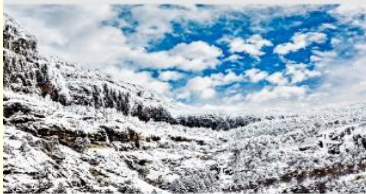
ภูเขาหิมะเจียวจื่อ