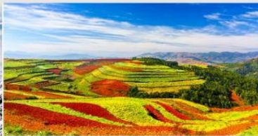
แผ่นดินสีแดง