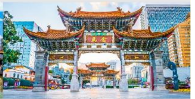
ประตูม้าทอง ไถ่หยก

*ทางบริษัทฯ ขอสงวนสิทธิ์ในการปรับเปลี่ยนโปรแกรมทัวร์ตามความเหมาะสมซึ่งไม่ได้แจ้งก่อนการเดินทาง โดยดำเนินการแจ้งและปรับโปรแกรมทัวร์ก่อนเดินทาง