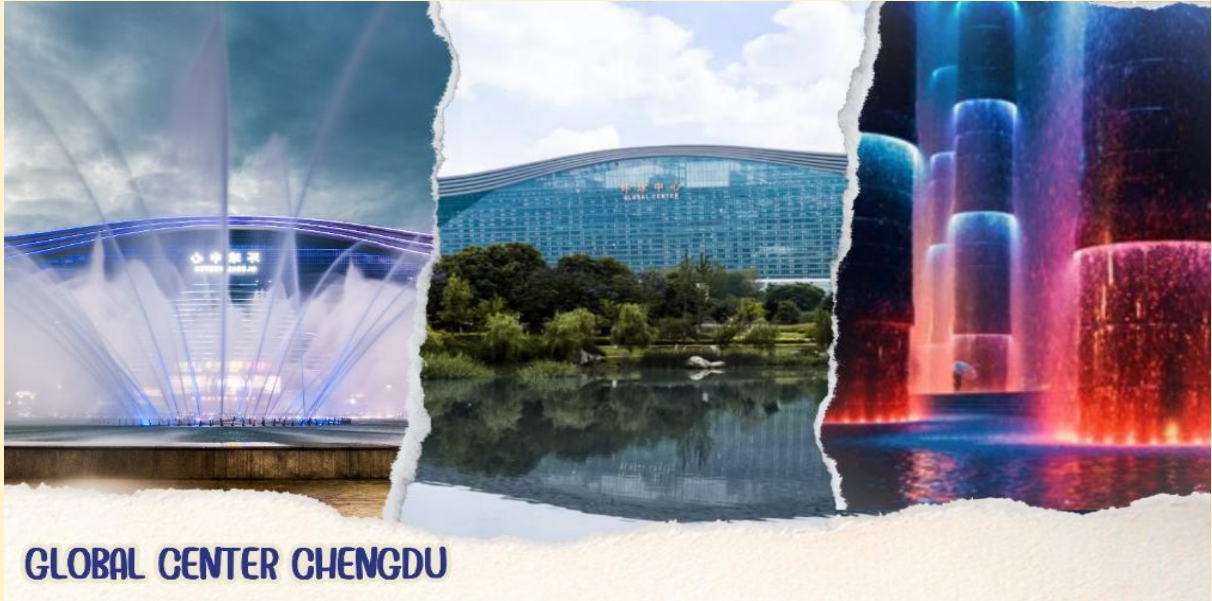
GLOBAL CENTER CHENGDU

รับประทานอาหารกลางวัน ณ ภัตตาคาร (มือที่ 5) เมนูพิเศษ...ปลาต้มผักกาดดอง