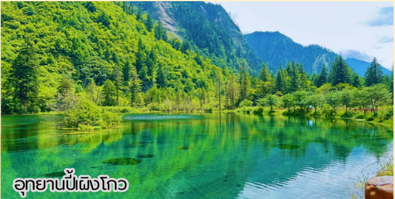
อุทยานπίงโกว

เช้า รับประทานอาหารเช้า ณ ห้องอาหารโรงแรม (มื้อที่ 1)