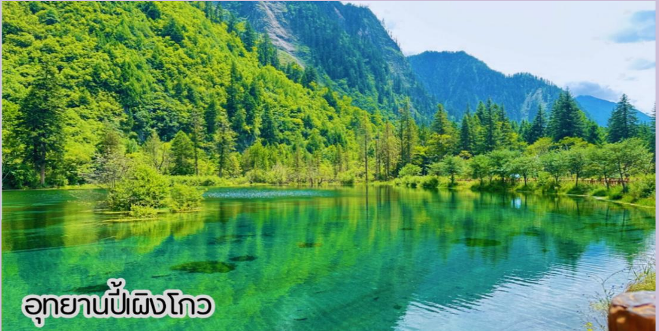
อุทยานπίงโกว

เช้า 🕒 รับประทานอาหารเช้า ณ ห้องอาหารของโรงแรม (มื้อที่ 4)