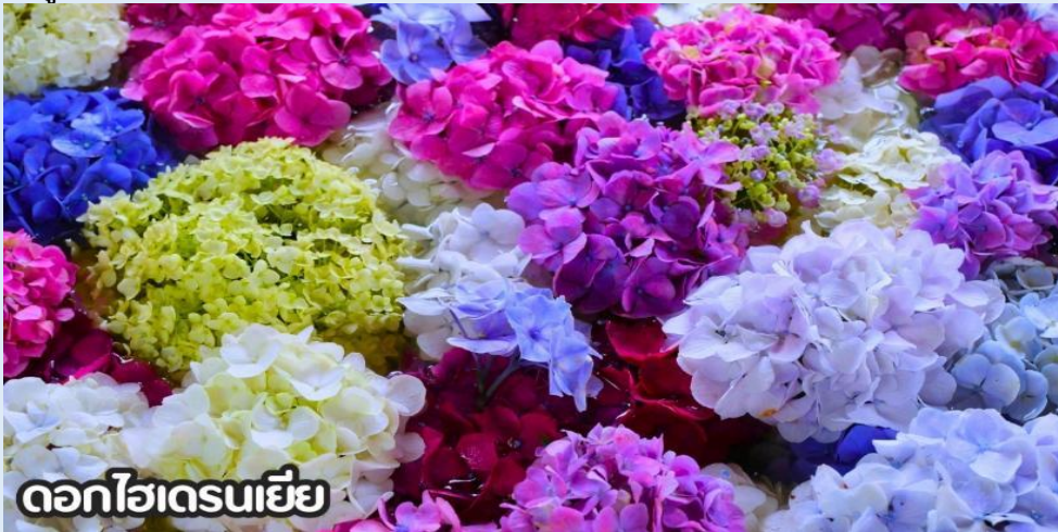
ดอกไฮเดรนเยีย

(ปลายเดือนพฤษภาคม-มิถุนายน): ชมดอกไม้ไฮเดรนเยีย ดอกไฮเดรนเยียที่คุนหมิง ประเทศจีน บานสะพรั่งสวยงามที่สุดในช่วงเดือนมิถุนายน โดยเฉพาะบริเวณทุ่งไฮเดรนเยีย (The Middle Sea Hydrangea Kunming) ซึ่งมีหลากหลายสีทั้งฟ้า ชมพู และม่วง เป็นจุดถ่ายรูปยอดนิยมที่ห้ามพลาด เนื่องจากอากาศที่เย็นสบายและทิวทัศน์ที่งดงาม