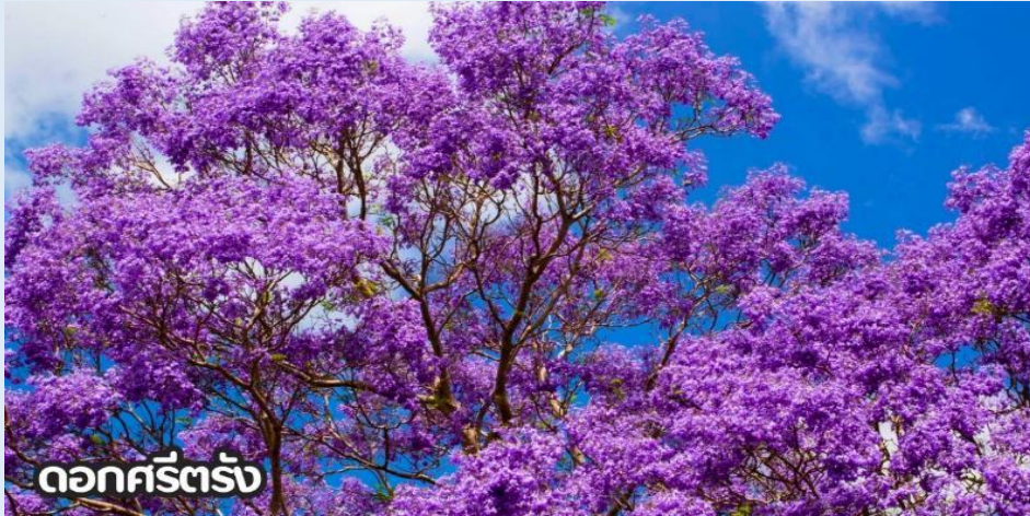
ดอกครีตรั้ง

(ปลายเดือนพฤษภาคม-มิถุนายน): ชมดอกไม้ไฮเดรนเยีย ดอกไฮเดรนเยียที่คุนหมิง ประเทศจีน บานสะพรั่งสวยงามที่สุดในช่วงเดือนมิถุนายน โดยเฉพาะบริเวณทุ่งไฮเดรนเยีย (The Middle Sea Hydrangea Kunming) ซึ่งมีหลากหลายสีทั้งฟ้า ชมพู และม่วง เป็นจุดถ่ายรูปยอดนิยมที่ห้ามพลาด เนื่องจากอากาศที่เย็นสบายและทิวทัศน์ที่งดงาม