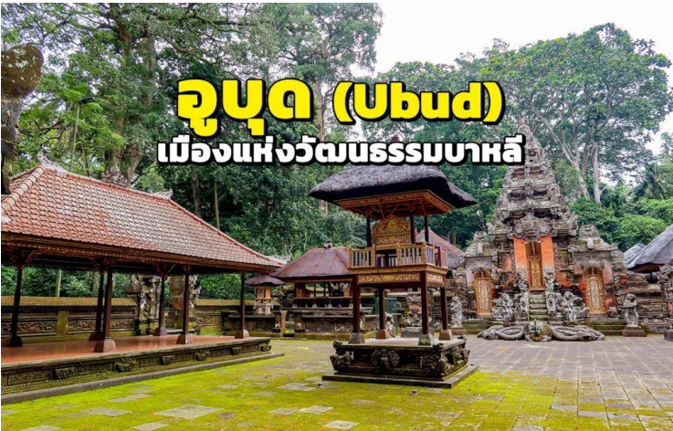
อุบุด (Ubud) เมืองแห่งวัฒนธรรมบาหลี่

จากนั้น พาท่าน สู่ อุบุด เป็นสถานที่ที่สวยงามและเป็นเอกลักษณ์ด้วยวัฒนธรรมและประวัติศาสตร์ที่หลากหลาย เมืองเล็กนี้มีบรรยากาศที่อบอุ่นและเป็นกลางใจของคนในพื้นที่ ความสวยงามของเมืองอุบุด ดั่งนั้นถูกสะท้อนในบรรยากาศท้องถิ่นที่เรียบง่ายและเต็มไปด้วยความสงบและความสงบ ที่นี้คุณจะได้พบวิถีชีวิตที่สงบและเพื่อนรักธรรมชาติ หากต้องการเข้าถึงความเป็นบาหลี่ "อุบุด" เป็นสถานที่ที่ตอบโจทย์มากที่สุด เพราะเป็นเมืองที่เป็นศูนย์รวมทั้งศิลปะและวัฒนธรรมบาหลี่เอาไว้มากที่สุด อุบุดเป็นแหล่งท่องเที่ยวที่เหมาะสำหรับการมาพักผ่อนชิลล์ๆ แบบสโลไลฟ์ ไม่เร่งรีบ ตื่นตากับธรรมชาติ สถาปัตยกรรม และวิถีชีวิตของคนบาหลี่ ที่นี้คุณสามารถละทิ้งความวุ่นวายเพื่อมาผ่อนคลายกับสิ่งที่อยู่ตรงหน้าให้ได้มากที่สุด