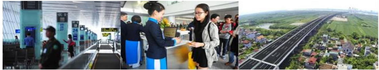
14.50 น. เดินทางถึงท่าอากาศยานนอยไบ (NoiBai) กรุงฮานอย เมืองหลวงของสาธารณรัฐสังคมนิยมเวียดนามหลังจากนำท่านผ่านพิธีการตรวจคนเข้าเมือง

WEBSITE : WWW.ROONGANANTOUR.CO ID LINE : @ROONGANANTOUR