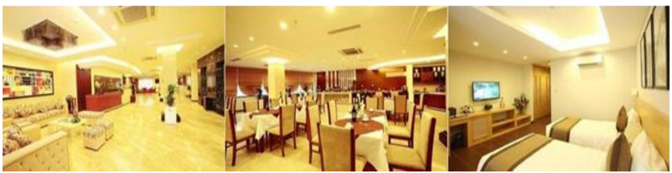
จากนั้นนำท่านเข้าสู่โรงแรมที่พัก HANOI HOTEL 3* หรือเทียบเท่า ที่พักผ่อนตามอัธยาศัย