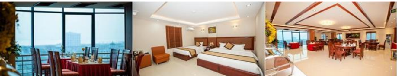
จากนั้นนำท่านเข้าสู่โรงแรมที่พัก HALONG HOTEL 4* หรือเทียบเท่า

เมื่อถึงเวลาสมควรนำพาท่านอิสระให้ช้อปปิ้ง ณ ตลาดกลางคืนไนท์ บาซาร์ (Night Market) ตลาดใหญ่ ราคาดีมีสินค้ามากมายหลายประเภททั้งสินค้าหัตถกรรมพื้นเมือง เสื้อผ้า เสื้อกันหนาว ของใช้ และยังมีสินค้าที่เป็นเอกลักษณ์ของเมืองชายหาดให้เลือกซื้อหลังจากช้อปปิ้งเสร็จนำท่านเช็คอินเข้าที่พัก พักผ่อนตามอัธยาศัย