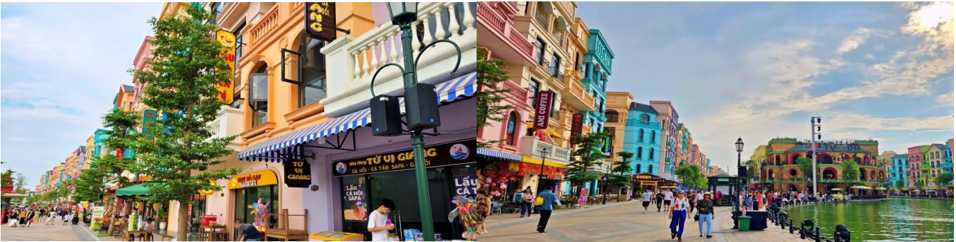
เที่ยง รับประทานอาหารเที่ยง (มื้อที่3) “แหนมเนืองเวียดนาม – ซุปไก่” (เป็นร้านแหนมเนืองขึ้นชื่อ) พร้อม Soft Drink

WEBSITE : WWW.ROONGANANTOUR.CO ID LINE : @ROONGANANTOUR