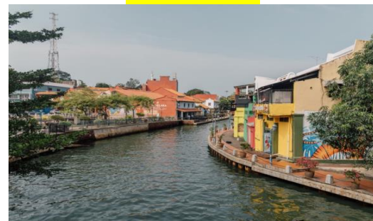
แม่น้ำมะละกา

หากมีเวลาท่านสามารถนั่งรถสามล้อริคชัว ชมเมืองมะละกาโดยรอบได้ตามอัธยาศัย (ค่านั่งรถไม่รวมในรายการทัวร์)