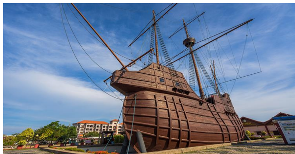
พิพิธภัณฑสถานสมุทรศาสตร์