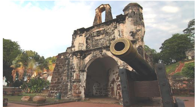
ป้อมปืนฝรั่งเศสเอฟาโมซา