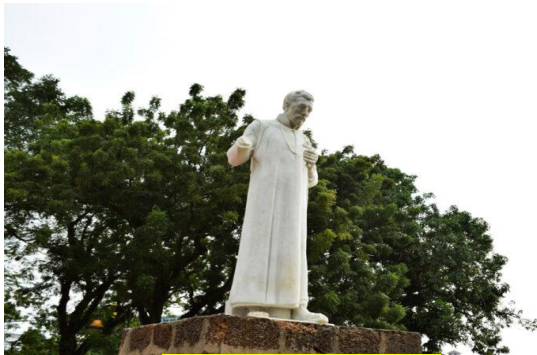
นักบุญฟรานซิส เซเวียร์