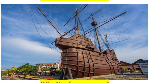
พิพิธภัณฑ์สมุทรศาสตร์