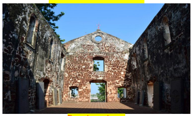
โบสถ์เซนต์พอล