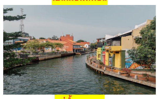
แม่น้ำมะละกา

หากมีเวลาท่านสามารถนั่งรถสามล้อริคชอร์ ชมเมืองมะละกาโดยรอบได้ตามอัธยาศัย (ค่านั่งรถไม่รวมในรายการทัวร์)