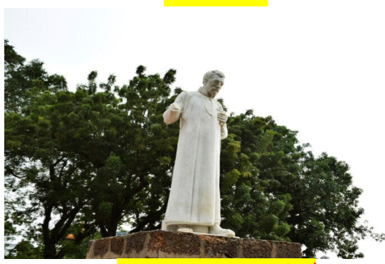
นักบุญฟรานซิส เซเวียร์