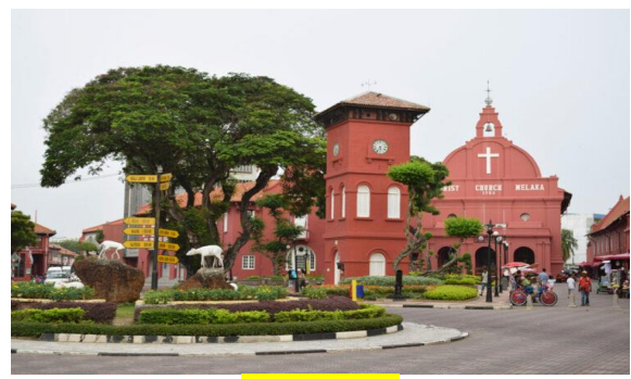
ดัตช์ สแควร์

ชม พิพิธภัณฑ์สมุทรศาสตร์มะละกา (Melaka Maritime Museum) เป็นลักษณะของเรือสำเภาจำลองของชาวโปรตุเกส ที่มีชื่อว่า Flora de La Mar เป็นเรือที่ใช้ในการมาขนส่งสมบัติอันล้ำค่าจากพระราชวังสุลต่านในเมืองมะละกา อีระกับการช้อปปิ้งสินค้าพื้นเมืองมากมาย