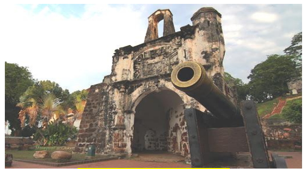
ป้อมปืนฝรั่งเศสเอฟาโมซา