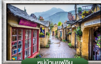
หมู่บ้านยูฟูอิน