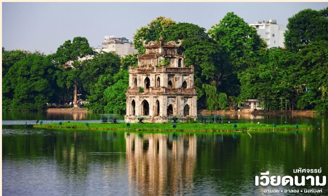
มัทศจรรย์ เวียดนาม ฮานอย • ฮาลอง • ฮึงห์บิงห์

📍 นำท่านชม ทะเลสาบคินดาบ ทะเลสาบใจกลางเมืองฮานอย ทะเลสาบแห่งนี้มีตำนานกล่าวว่า ในสมัยที่เวียดนามทำสงครามสู้รบกับประเทศจีน แต่ยังไม่สามารถเอาชนะทหารจากจีนได้สักที ทำให้เกิดความท้อแท้พระทัย เมื่อได้มาล่องเรือที่ทะเลสาบแห่งนี้ ได้มีเต่าขนาดใหญ่ตัวหนึ่งได้คาบดาบวิเศษมาให้พระองค์ เพื่อทำสงครามกับประเทศจีนหลังจากที่พระองค์ได้รับดาบมานั้น พระองค์ได้กลับไปทำสงครามอีกครั้ง และได้รับชัยชนะเหนือประเทศจีน ทำให้บ้านเมืองสงบสุข เมื่อเสร็จศึกสงครามแล้ว พระองค์ได้นำดาบมาคืน ณ ทะเลสาบแห่งนี้