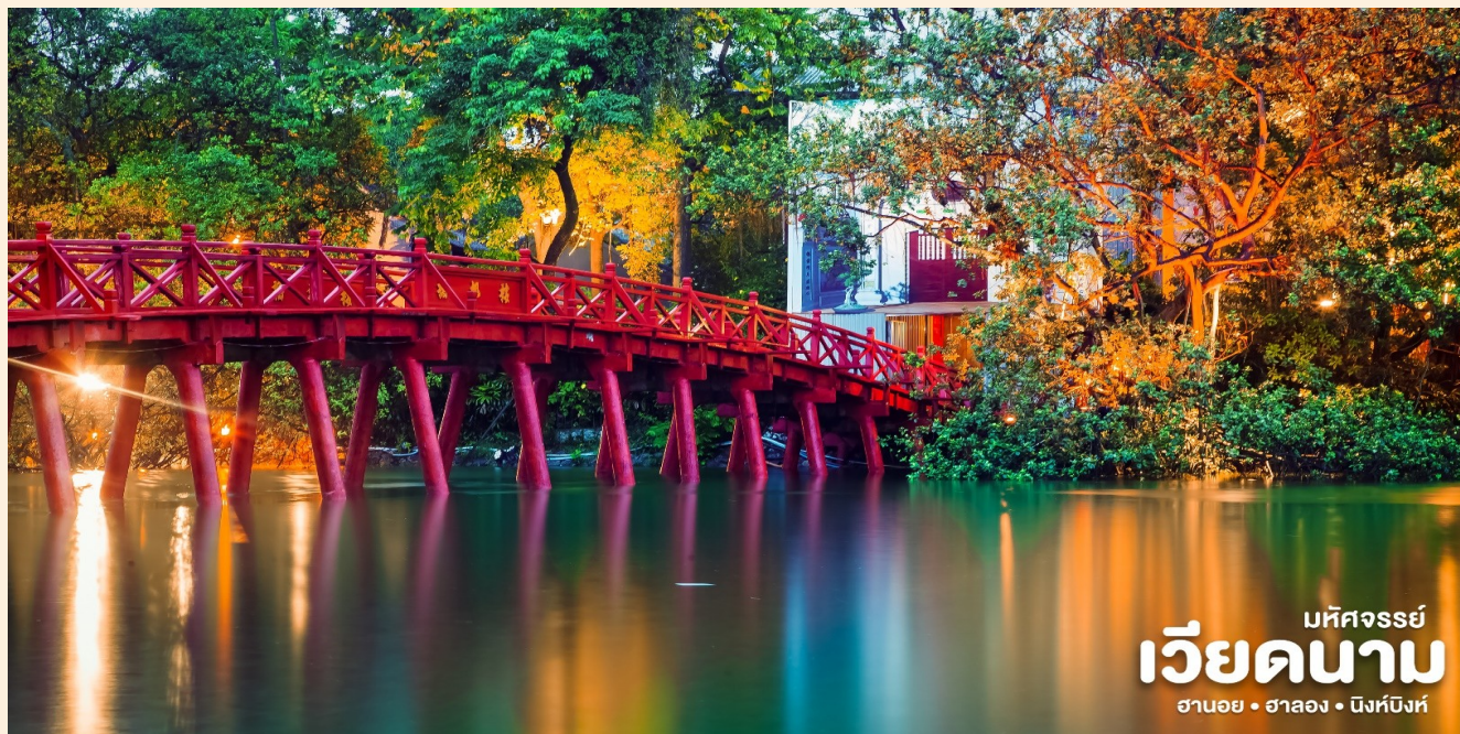
มัทศจรรย์ เวียดนาม ฮานอย • ฮาลอง • ฮึงห์บิงห์

📍 จากนั้นนำท่านเข้าชม สะพานแสงอาทิตย์ สีแดงสดใสสู่กลางทะเลสาบคินดาบ ชม วัดหังอกเซิน วัดโบราณ ภายในประกอบด้วย ศาลเจ้าโบราณ และ เต่าสตัฟ ขนาดใหญ่ ซึ่งมีความเชื่อว่า เต่าตัวนี้ คือเต่าศักดิ์สิทธิ์ 1 ใน 2 ตัวที่อาศัยอยู่ในทะเลสาบแห่งนี้มาเป็นเวลาช้านาน นำท่าน อิสระช้อปปิ้งถนน 36 สาย มีสินค้าราคาถูกให้ท่านได้เลือกสรรมากมาย กระเป๋า เสื้อผ้า รองเท้า ของที่ระลึกต่างๆ ฯลฯ