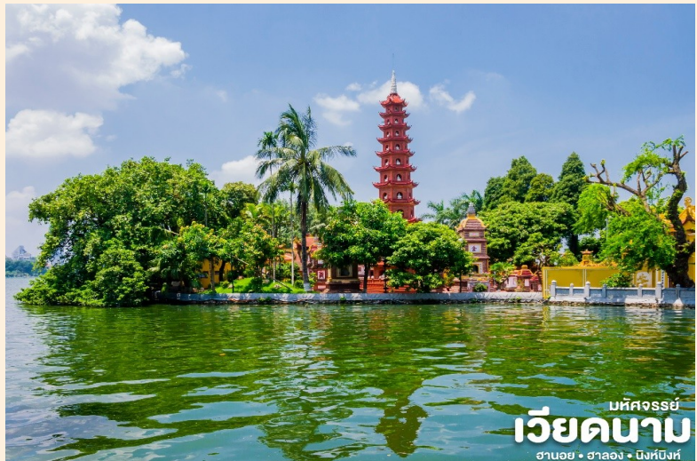
เบทีศรร์ย เวียดนาม ฮานอย • ฮาลอง • บังบั้ง

📍 นำท่านเดินทางสู่ วัดเจินก๊วก เป็นวัดที่อยู่ใจกลางเมืองของเวียดนาม ใกล้ชิดกับทะเลสาบตะวันตกของเมืองฮานอย ภายในวัดมี เจดีย์เจินก๊วก (Chua Tran Quoc) เป็นเจดีย์ที่สำคัญและเก่าแก่ของชาวเวียดนาม การสร้างเจดีย์แห่งนี้ ใช้ศิลปะที่มีการผสมผสานกันอย่างลงตัวระหว่างสถาปัตยกรรมจีนและเวียดนาม มีความสูง 15 เมตร มีทั้งหมด 11 ชั้น ภายในมีจารึกประวัติความเป็นมาทั้งของเจดีย์และพระศรีศากยมุนีปางปรินิพพานที่ทำด้วยทองคำ