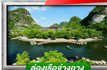
ล่องเรือจางอว