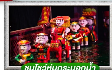
ชมโชว์หุ่นกระบอกน้ำ