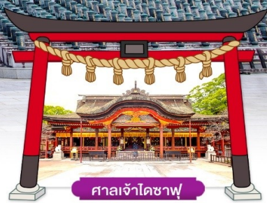
ศาลเจ้าโดซาฟุ