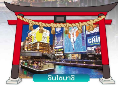
ชินไซบาชิ