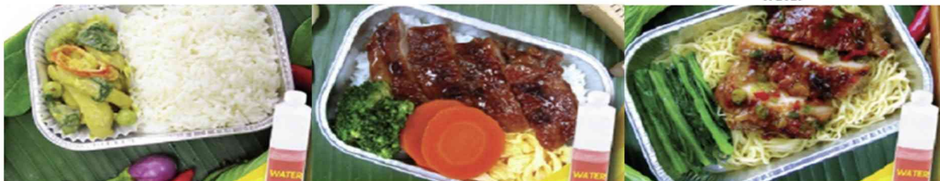
Chicken roasted with herb and noodle and water