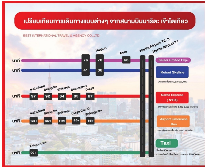
ตารางเปรียบเทียบราคาการเดินทางเข้าในเมืองโตเกียว

ช่วงเช้า เพราะมีทั้งนักรูกริก พ่อค้าแม่ค้า และนักท่องเที่ยวต่างชาตินิยมมาเยี่ยมชมอย่างไม่ขาดสาย นอกจากอาหารทะเลแล้วยังมีผัก ผลไม้ ประจำฤดูไว้คอยบริการทุกท่านอีกด้วย