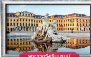
พระราชวังเซ็นบรุนน์