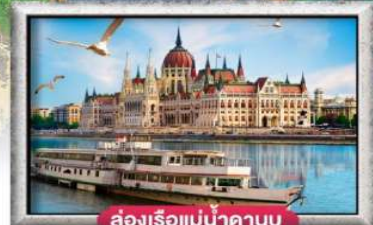
ส่องเรือแม่น้ำดานูบ

พิเศษ!! ลิ้มลองเมนูประจำชาติ ทั้ง 5 ประเทศ!!!