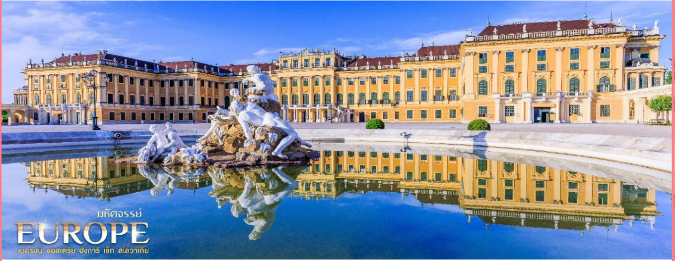
มหิตจรรย EUROPE เยอรมนี ออสเตรีย ฮังการี เช็ก สโลวาเกีย

เที่ยง บริการอาหารกลางวัน ณ ภัตตาคารท้องถิ่น เมนู พิเศษ Sacher Cake เค้กสุดคลาสสิก ของเวียนนา