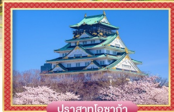
ปราสาทโอซาก้า