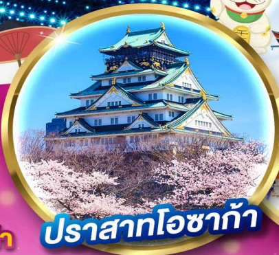
ปราสาทโอซาก้า