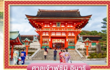
ศาลเจ้าฟูชิมิ อินาริ