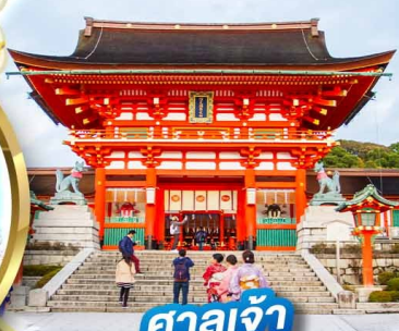
ศาลเจ้าฟูชิมิ อินาริ