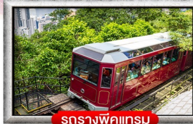
รถรางพิกแตรม