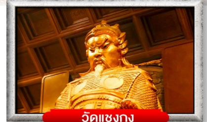
วัดแชงกง