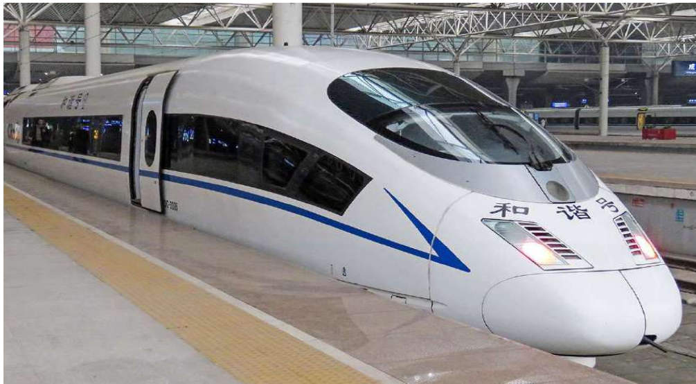
T2G-KMG05KY WINTER KUNMING คุนหมิง ต้าหลี่ ลีเจียง แขวงกริลา ภูเขาหิมะมังกรหยก 6D 5N (KY)

เมื่อเดินทางถึง เมืองต้าหลี่ นำท่านขึ้นรถบัส เพื่อเดินทางท่องเที่ยวตามโปรแกรม