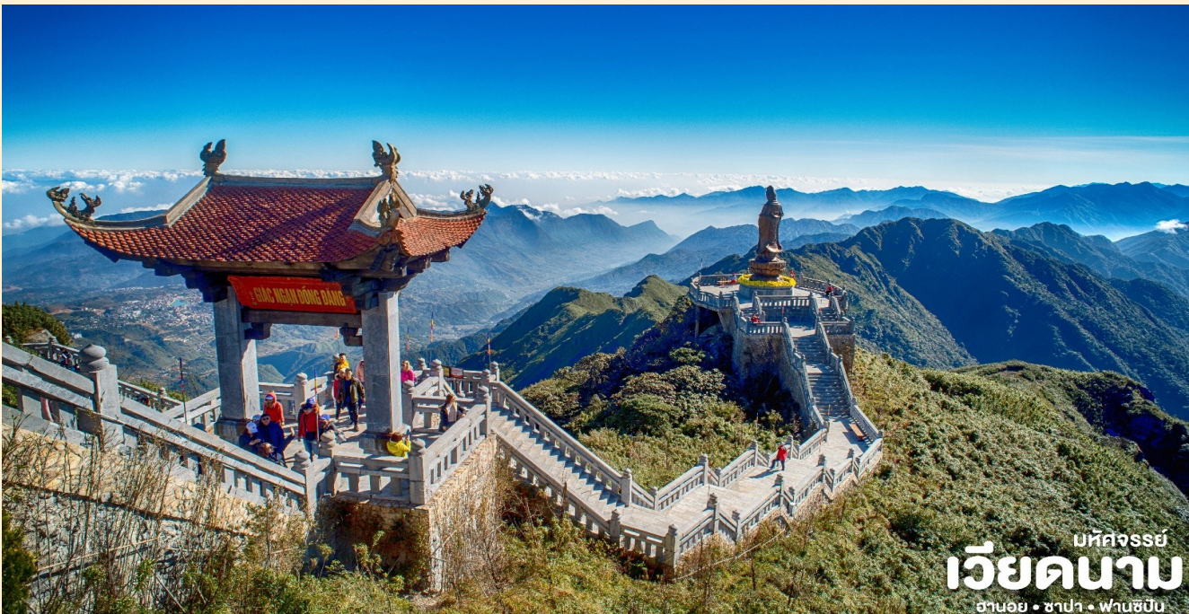
มัทคจรรย์ เวียดนาม ฮานอย • ซาปา • ฟานซิปัน