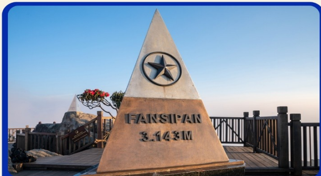
นั่งกระเช้าสู่อยอดเขาฟานซิปัน