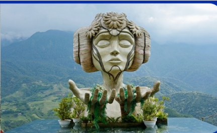
เช็คอิน โมอาน่า (Moana Sapa Cafe)