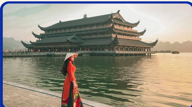
จุดเช็คอินแห่งใหม่ "วัดตามจุ๊ก"