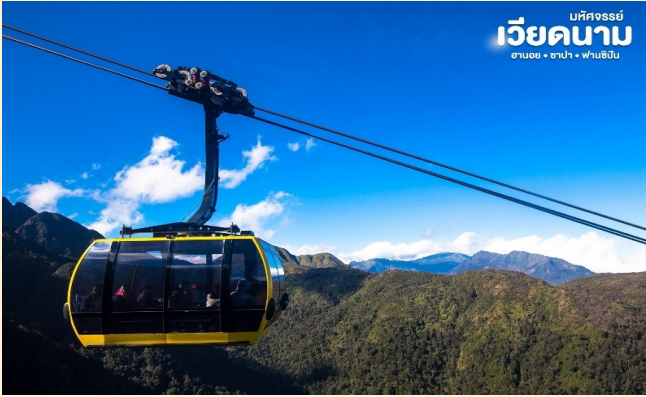
มัทคจรรย์ เวียดนาม ฮานอย • ซาปา • ฟานซิปัน