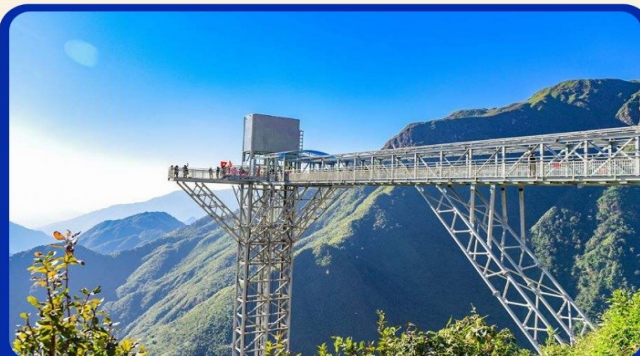
สะพานแก้วมังกรเมฆ (Rong May Glass Bridge)