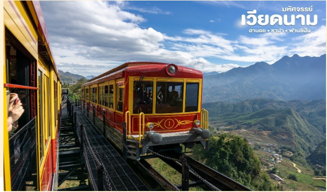
มัทคจรรย์ เวียดนาม ฮานอย • ซาปา • ฟานซิปัน