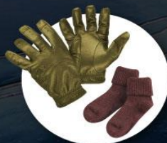
ถุงมือหนาขนนก กางเกงกันหนาวแบบหนา