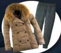
เสื้อและกางเกงกันหนาว, กันลม