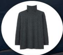
Heattech (ฮีทเทค) แบบหนาพิเศษ กึ่งกางเกงและเสื้อ

1. เสื้อผ้าควรเตรียมเสื้อผ้าสำหรับป้องกันความหนาวใช้ในอุณหภูมิต่ำสุด -40 องศาโดยประมาณ