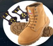
รองเท้าสำหรับเดินบนหิมะ น้ำแข็ง หรือติดที่กันลื่น Ice grippers