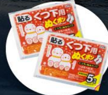
แผ่นความร้อนสำหรับให้ความอบอุ่นร่างกาย

2. บนเกาะโอลค์ฮอนจะมีอากาศหนาวมากต้องเตรียมกระติกน้ำเก็บความร้อนแบบพกพาได้ไปด้วย เพื่อต้มน้ำให้ความอบอุ่นร่างกาย