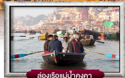
ล่องเรือแม่น้ำคงคา

พิเศษ ชมพิธีคองคาอารตี พร้อม กระจกดอกไม้