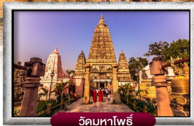
วัดมหาโพธิ์