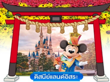
ดิสนีย์แลนด์อิสระ