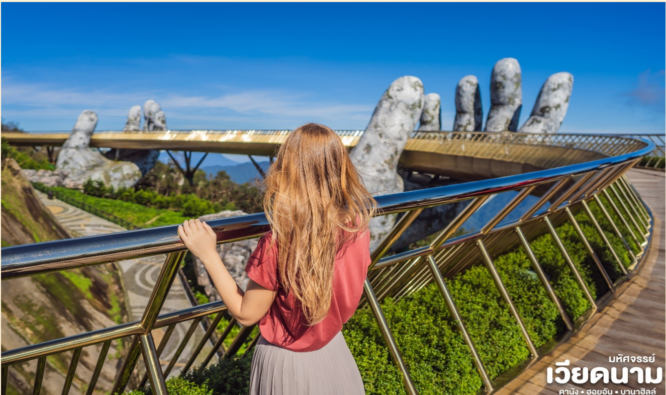
มหัศจรรย์ เวียดนาม คาบิง • ฮอยอัน • บานาฮิลล์

เพราะอากาศที่หนาวเย็นเฉลี่ยตลอดทั้งปีประมาณ 10 องศาเท่านั้นจุดที่สูงที่สุดของบานาฮิลล์มีความสูง 1,467 เมตรกับสภาพป่าที่อุดมสมบูรณ์ นำท่านชม สะพานสีทอง สถานที่ท่องเที่ยวใหม่ล่าสุดตั้งโดดเด่นเป็นเอกลักษณ์อย่างสวยงาม บนเขาบานาฮิลล์