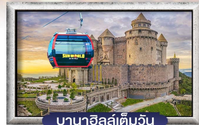
บาน่าฮิลล์เต็มวัน