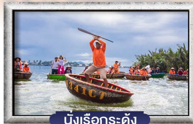
นั่งเรือกระดิง