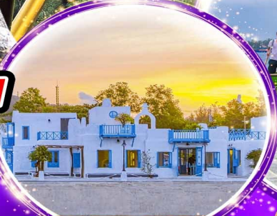
SON TRA MARINA