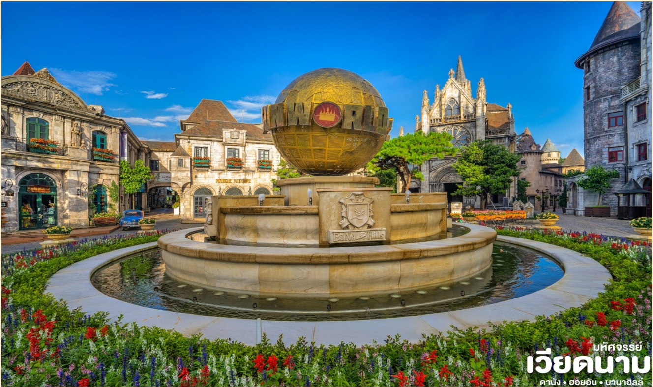
มทศจรรย เวียดนาม คานัง • ออยอิน • บานาฮิลล์