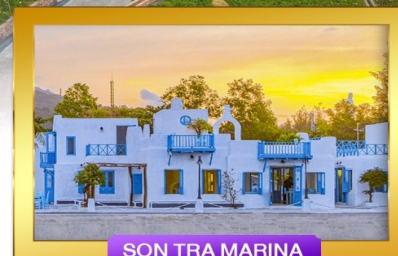
SON TRA MARINA