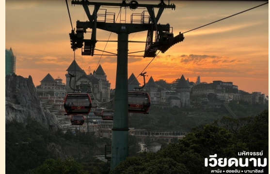
มทศจรรย เวียดนาม คานัง • ออยอิน • บานาฮิลล์

นั่งกระเช้าขึ้นสู่บานาฮิลล์ กระเช้าแห่งบานาฮิลล์นี้ได้รับการบันทึกสถิติโลกโดย World Record ว่าเป็นกระเช้าไฟฟ้าที่ยาวที่สุด ประเภท Non Stop โดยไม่หยุดแะมีความยาวทั้งสิ้น 5,042 เมตร และเป็นกระเช้าที่สูงที่สุด 1,294 เมตร นักท่องเที่ยวจะได้สัมผัสพุ่มเมฆหมอกและบางจุดมีเมฆลอยต่ำกว่ากระเช้าพร้อมอากาศบริสุทธิ์อันสดชื่นจนทำให้ท่านอาจลืมไปเสียด้วยซ้ำว่าที่นี่ไม่ใช่ยุโรปเพราะอากาศที่หนาวเย็นเฉลี่ยตลอดทั้งปีประมาณ 10 องศาเท่านั้น