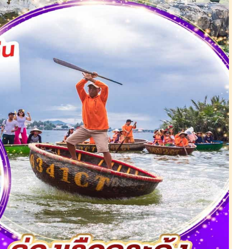
ล่องเรือกระดังงา