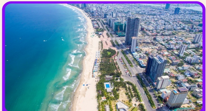
เช็คอิน ชายหาดหมีคว เป็นชายหาดที่สวยงามที่สุดในเมืองดานัง