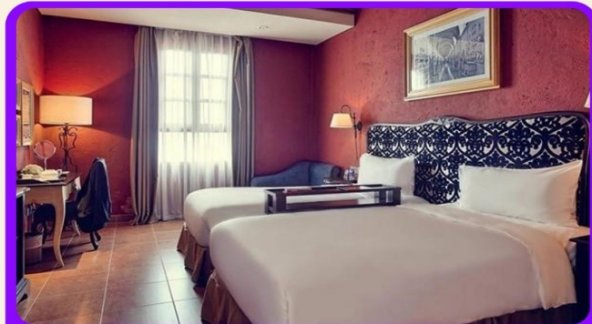
พักบนบานาฮิลล์ 1 คืน