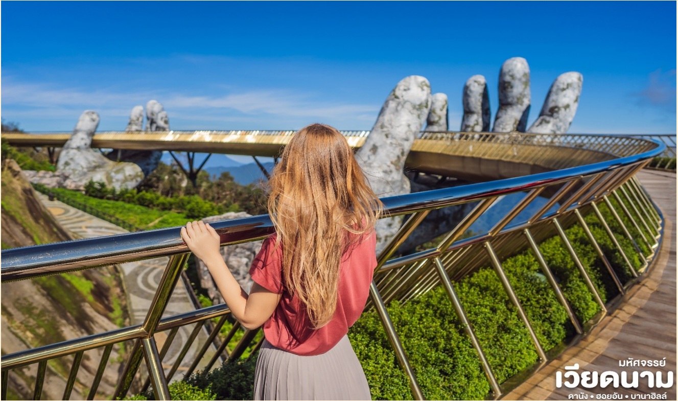
มหัศจรรย์ เวียดนาม ดานัง • ฮอยอัน • บานาฮิลล์

นำท่านชม สะพานสีทอง สถานที่ท่องเที่ยวใหม่ล่าสุดตั้งโดดเด่นเป็นเอกลักษณ์อย่างสวยงามบนเขabanahill นำท่านสู่จุดที่สร้างความตื่นเต้นให้นักท่องเที่ยวมองดูอย่างอึ้งการที่ซึ่งเต็มไปด้วยเสน่ห์แห่งตำนานและจินตนาการของการผจญภัยที่ สวนสนุก The Fantasy Park (รวมค่าเครื่องเล่นบนสวนสนุก ยกเว้น ทุนซีตี้