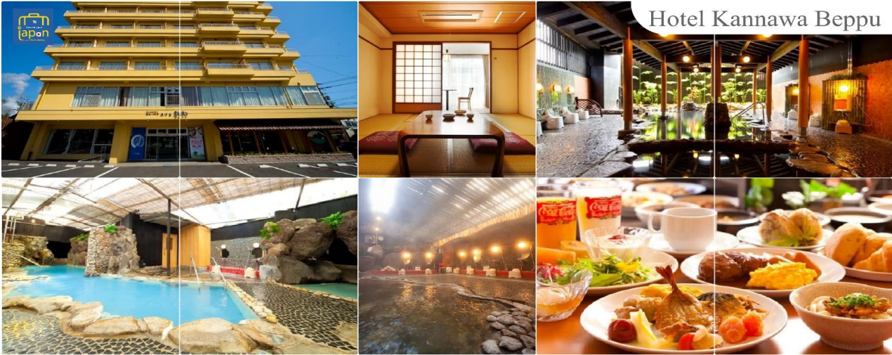
Hotel Kannawa Beppu

จากนั้นให้ท่านได้ผ่อนคลายกับการ แช่น้ำแร่ออนเซนธรรมชาติ เชื่อว่าถ้าได้แช่น้ำแร่แล้ว จะทำให้ผิวพรรณสวยงามและช่วยให้ระบบหมุนเวียนโลหิตดีขึ้น