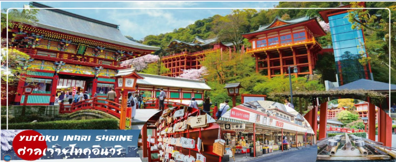
YUTOKU INARI SHRINE ศาลเจ้ายูโทคุอินาริ