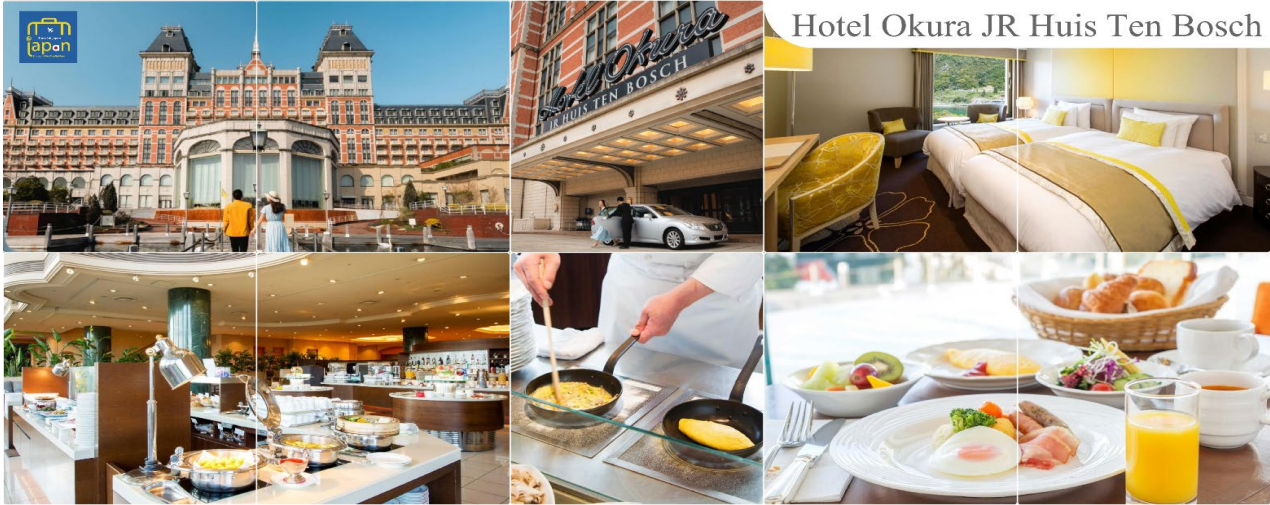
Hotel Okura JR Huis Ten Bosch