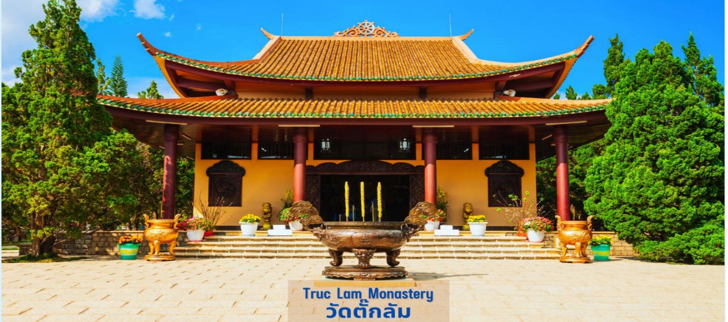
Truc Lam Monastery วัดตักกัม

นำท่าน นั่งกระเช้า เพื่อเข้าไปเที่ยวชม วัดตักกัม (Truc Lam Monastery) เป็นวัดพุทธในนิกายเซน แบบญี่ปุ่น ตั้งอยู่บนเทือกเขาเฟื่องฮว่าง ภายในบริเวณวัดนอกจากจะมีสิ่งก่อสร้างที่สวยงาม สะอาด เป็นระเบียบเรียบร้อยแล้ว ยังมีการจัดทัศนียภาพโดยรอบด้วยสวนดอกไม้ที่ผลิดอกบานสะพรั่ง นับได้ว่าเป็นวิหารซึ่งเป็นที่นิยมและงดงามที่สุดในดาลัด