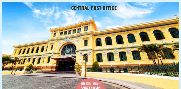
CENTRAL POST OFFICE

สมควรแก่เวลานำท่านเดินทางสู่ สนามบินเดินเซินญี๊ต เพื่อเดินทางกลับสู่ประเทศไทย