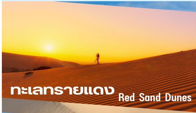
ทะเลทรายแดง Red Sand Dunes