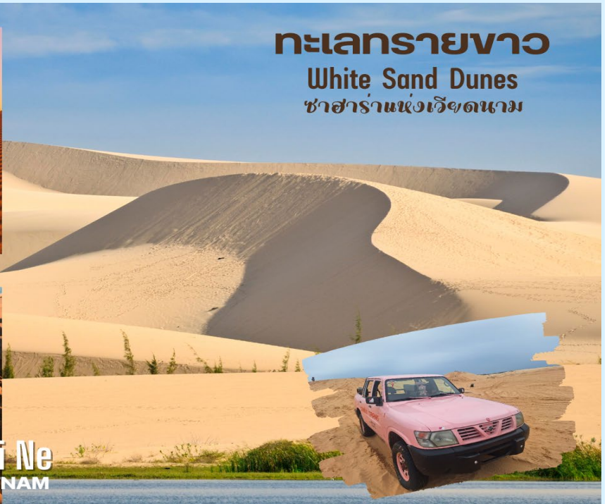
ทะเลทรายขาว White Sand Dunes ซาฮาราแห่งเวียดนาม