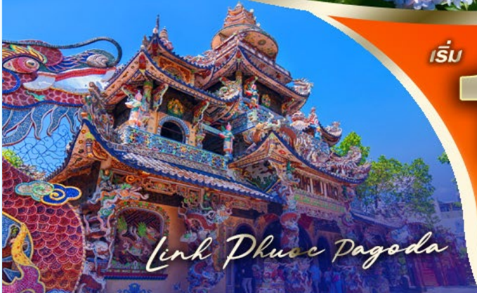
Linh Phuoc Pagoda