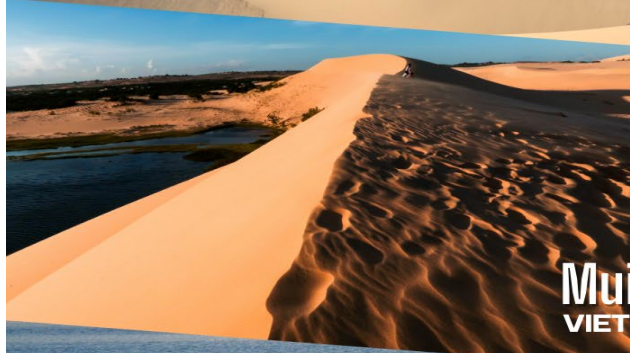
Mui Ne VIETNAM