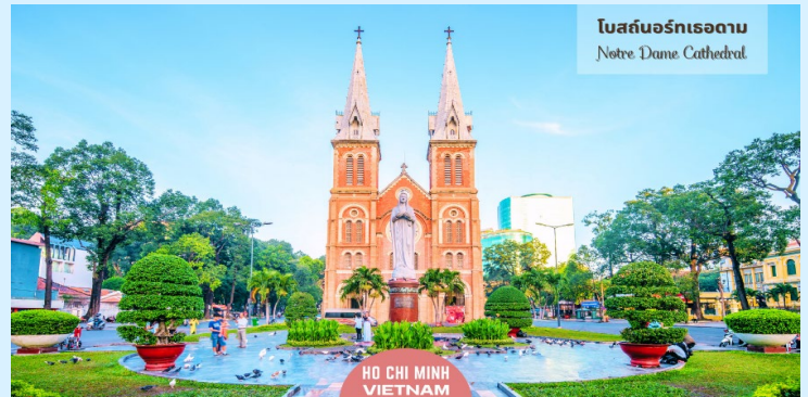
โบสถ์นอร์เทอดาม Notre Dame Cathedral