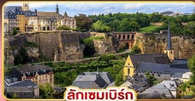
ลักเซมเบิร์ก