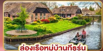
ล่องเรือหมู่บ้านที่รูร์น