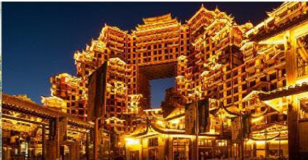
ตึก 72 ชั้น

*ทางบริษัทฯ ขอสงวนสิทธิ์ในการสลับโปรแกรมทัวร์ตามความเหมาะสมขึ้นอยู่กับสถานการณ์หน้างาน โดยคำนึงถึงผลประโยชน์ของลูกค้าเป็นสำคัญ