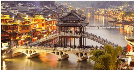
เมืองเฟิ่งหวง