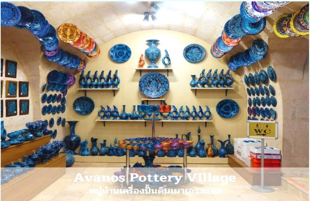
Avanos Pottery Village หมู่บ้านเครื่องปั้นดินเผาอวานอส

จากนั้นนำท่านแวะชม หมู่บ้านเครื่องปั้นดินเผาอวานอส (AVANOS) หมู่บ้านที่มีชื่อเสียงเกี่ยวกับเครื่องปั้นดินเผา อุปกรณ์ที่ใช้ภายในบ้าน ถ้วย,ชาม,ไห,โถ่ง,แจกันและเครื่องประดับบ้าน