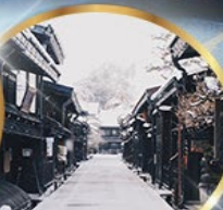
ตากายามา