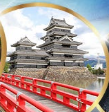
ปราสาทมิตสึโมโตะ