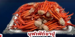
บุฟเฟ่ต์ซาชิมู