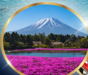
ฟูจิซึบะซาทุระ