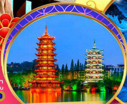
เจดีย์จินเจดีย์ทอง