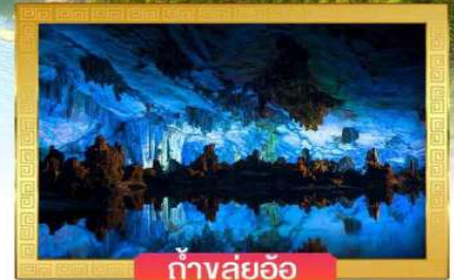
ถ้ำสุ่ยอ้อ