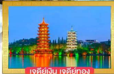
เจดีย์เงิน เจดีย์ทอง