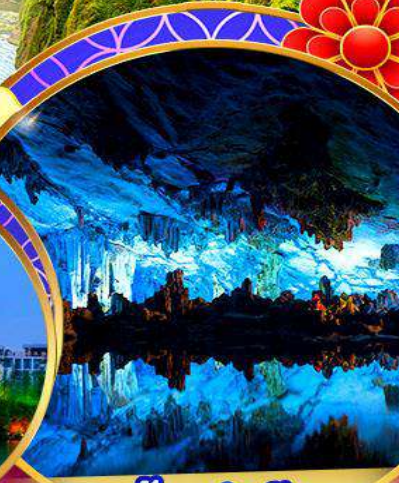
ถ้ำลู่ย้อ