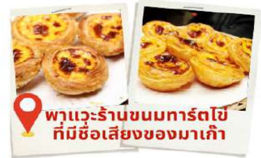
พาแวะร้านขนมทาร์ตไข่ ที่มีชื่อเสียงของมาเก๊า

สถานที่นี้โดดเด่นไปด้วยสถาปัตยกรรมตะวันตก ตกแต่งด้วยเสาแบบโรมันและรูปปั้นนักบุญสำคัญของศาสนาคริสต์ แต่เดิมเป็นโบสถ์ที่ใหญ่ที่สุดในมาเก๊า สร้างขึ้นตั้งแต่ปี ค.ศ. 1602-1637 เพื่อเป็นศูนย์รวมแรงศรัทธาของชาวคริสต์ แต่แล้วก็เกิดเหตุไฟไหม้จากห้องครัวของโบสถ์เมื่อปี ค.ศ. 1835 ลุกลามไปทั่วจนทำให้ตัวโบสถ์พังทลาย เหลือเพียงส่วนหน้าประตูที่ยังไม่ถูกทำลาย จนกระทั่งปี ค.ศ. 1991 ที่มีการบูรณะซากประตูโบสถ์อีกครั้ง ทำให้ที่นี่กลายเป็นหนึ่งในสถานที่ท่องเที่ยวที่มีความสำคัญต่อประวัติศาสตร์มาเก๊า และได้รับการยกย่องให้เป็นมรดกโลก