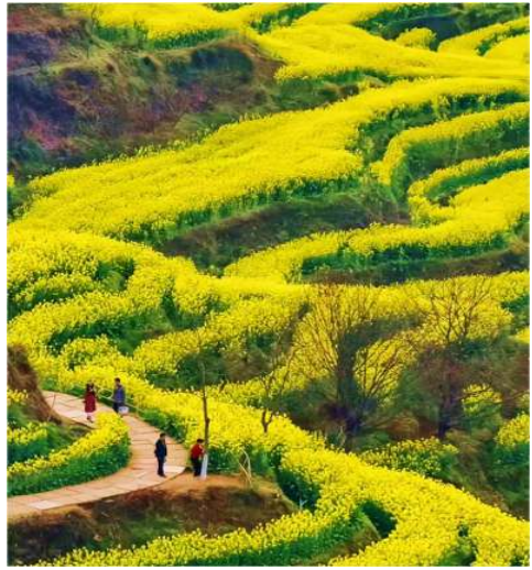
T2G-CSX03FD ภูเขาเทวดาวังเซียนกู่ อู่หยวน หนานชาง ฉางซา 5D 4N (FD) ไม่ลงร้านรัฐบาล

หมู่บ้านแห่งนี้ หากมองจากมุมสูง จะเห็นไอหมอกที่ปกคลุมไปทั่วหมู่บ้าน ทศนียภาพของเส้นทางที่คดเคี้ยวตัดกับต้นไม้สีเขียวสดใสนยอตา และนาขั้นบันไดที่ไกลสุดลูกหูลูกตา ในช่วงเดือนมีนาคม - พฤษภาคมของทุกปี นาขั้นบันไดเหล่านั้น จะถูกปกคลุมด้วยดอกสีเหลืองๆ เต็มไปหมด เป็นภาพที่สวยงามเกินบรรยาย