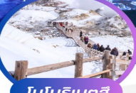
โนโบริเบตสึ