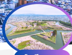
โทริยาคาคุ