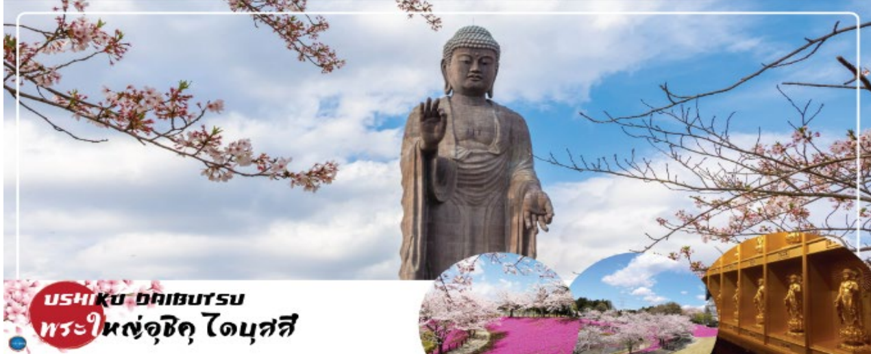
USHIKU DAIBUTSU พระใหญ่อุซึกุ ไดบุตสึ

นำท่านนมัสการ พระใหญ่อุซึกุ ไดบุตสึ (Ushiku Daibutsu) (ใช้เวลาเดินทางประมาณ 50 นาที) เป็นพระพุทธรูปปางยืนที่สูงที่สุดของประเทศญี่ปุ่น และเคยเป็นรูปปั้นที่สูงที่สุดในโลกที่ถูกบันทึกไว้โดยหนังสือบันทึกสถิติโลกกินเนสบุ๊ค (Guinness Book of world records) เมื่อปี ค.ศ. 1995 ด้วยความสูงถึง 120 เมตร ทำให้สามารถมองเห็นได้ตั้งแต่ใจกลางเมืองโดเกียวเลยทีเดียว สามารถเข้าไปยังบริเวณภายในรูปปั้นและขึ้นไปยังจุดที่เป็นหอสังเกตการณ์ในระดับความสูงที่ 85 เมตร ซึ่งจะอยู่ตรงส่วนของหน้าอกพระพุทธรูป เป็นจุดที่สามารถมองเห็น วิวในมุมด้านกว้างได้ ทั้งหมด บนชั้นนี้จะมีกระจกที่เป็นช่องหน้าต่างอยู่ด้วยกัน 4 ด้าน และมองเห็นภูเขาไฟฟูจิได้จากตรงนี้อีกด้วย ( ราคาไม่รวมค่าเข้าพระพุทธรูปด้านใน ) บริเวณใกล้เคียงจะมีสวนขนาดใหญ่เนื่องจากต้นไม้ในสวนส่วนมากเป็นต้นซากุระ ในช่วงที่ซากุระบานที่นี่จึงสวยงามเป็นพิเศษ เรียกได้ว่ามาไหว้พระอย่างเดียวก็น่าประทับใจแล้ว แล้วยังได้อึ้งใจไปกับวิวสวยๆอีกด้วย ( จุดชมซากุระขึ้นกับภูมิอากาศ ) ( ราคาไม่รวมค่าเข้าชมสวน ) นำท่านเดินทางสู่ เมืองนาริตะ (ใช้เวลาเดินทางประมาณ 40 นาที)