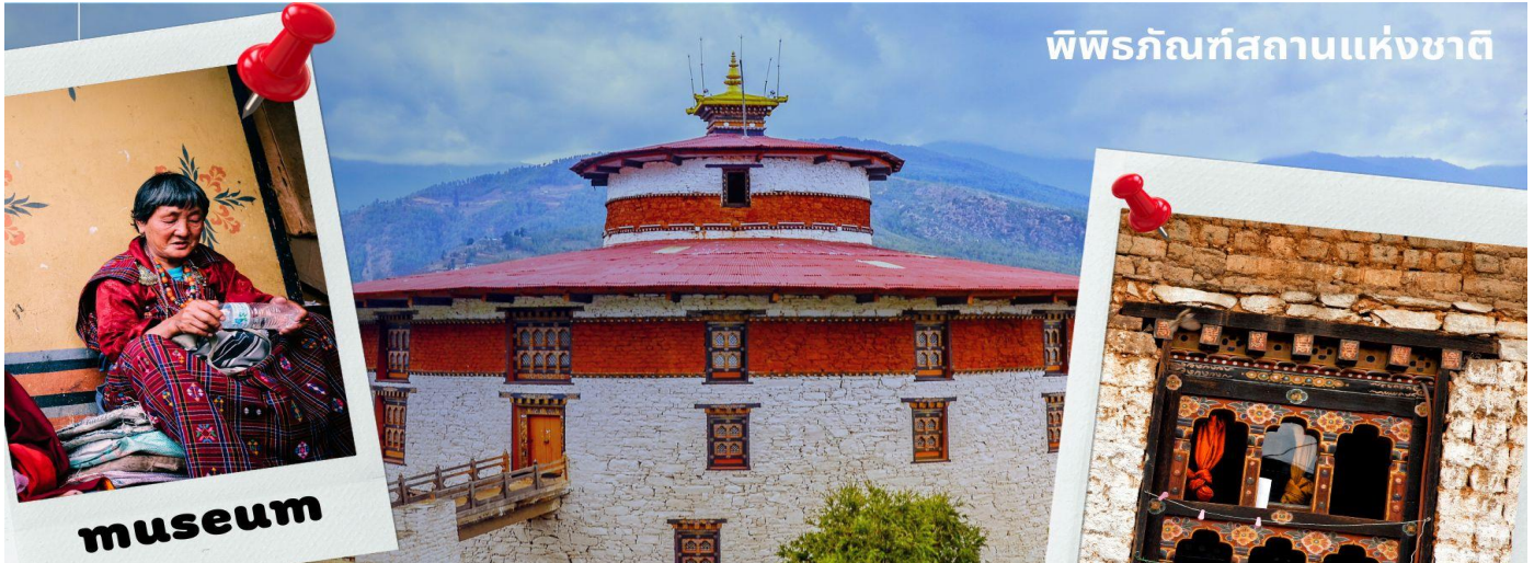
พิพิธภัณฑสถานแห่งชาติ