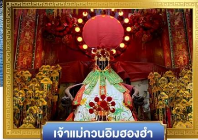
เจ้าแม่กวนอิมสองห้า