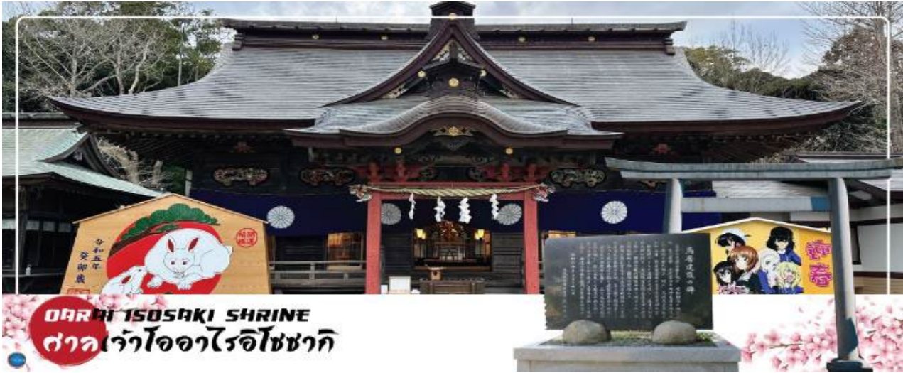
OARAI ISOSAKI SHRINE ศาลเจ้าโออาไรอิโซซากิ

เมืองนาริตะ – จังหวัดอิบารากิ – ตลาดปลาโออาไร – ศาลเจ้าโออาไรอิโซซากิ – เสาโทริแห่งคามิอิโซะ – สวนฮิดาชิ ซึโซะ – เมืองนาริตะ – อีออน มอลล์