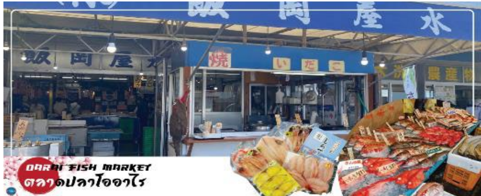
OARAI FISH MARKET ตลาดปลาโออาไร

และบริเวณใกล้เคียงกันนำท่านสู่ ตลาดปลาโออาไร (Oaraicho) ท่านสามารถชิมอร่อยกับอาหารทะเลสดใหม่ส่งตรงมาจากท่าเรือประมงโออาไร อาทิ ข้าวหน้าปลาดิบ หรืออาหารทะเลปิ้งย่าง นอกจากนี้ยังมีอาหารทะเลตากแห้งที่ทำเองโดยชาวประมง ซึ่งเหมาะสำหรับเป็นของฝากอีกด้วย อิสระรับประทานอาหารทะเลสดๆ แบบปิ้งย่าง เพลิดเพลินกับหลากหลายเมนู ปลาสดๆ เช่น ปลาอังโค ปลาชิราสุ (ปลาข้าวสาร) ตามแต่ฤดูกาล หอยเชลล์ หอยดัลส์ หอยนางรม หมึกย่างเนย และกุ้ง เป็นต้น