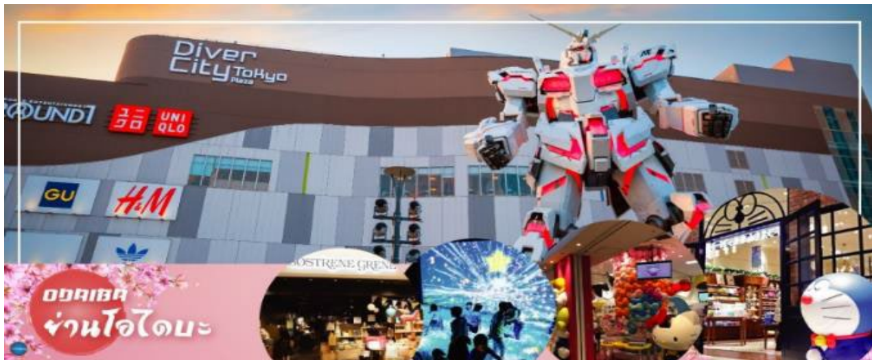
ODAIBA ย่านโอไดบะ

เดินทางสู่ ย่านโอไดบะ (Odaiba) (ใช้เวลาเดินทางประมาณ 30 นาที) คือเกาะที่สร้างขึ้นไว้เป็นแหล่งช้อปปิ้ง และแหล่งบันเทิงต่างๆ ในอ่าวโตเกียว ได้รับการปรับปรุงให้มีชื่อเสียงและเป็นที่นิยมในช่วงหลังของปี 1990 นอกจากมีสถาปัตยกรรมที่สวยงามตั้งอยู่มากมายแล้ว แต่ก็ยังคงความเป็นธรรมชาติไว้ด้วยความอุดมสมบูรณ์ของพื้นที่สีเขียว ไทเวอร์ซิตี โตเกียว พลาซ่า (Diver City Tokyo Plaza) เป็นห้างดังอีกห้างหนึ่ง ที่อยู่บนเกาะ โอไดบะ จุดเด่นของห้างนี้ก็คือ หุ่นยนต์กันดั้มขนาดเท่าของจริง ซึ่งมีขนาดใหญ่มาก ในบริเวณห้าง อิสระช้อปปิ้งตามอัธยาศัย