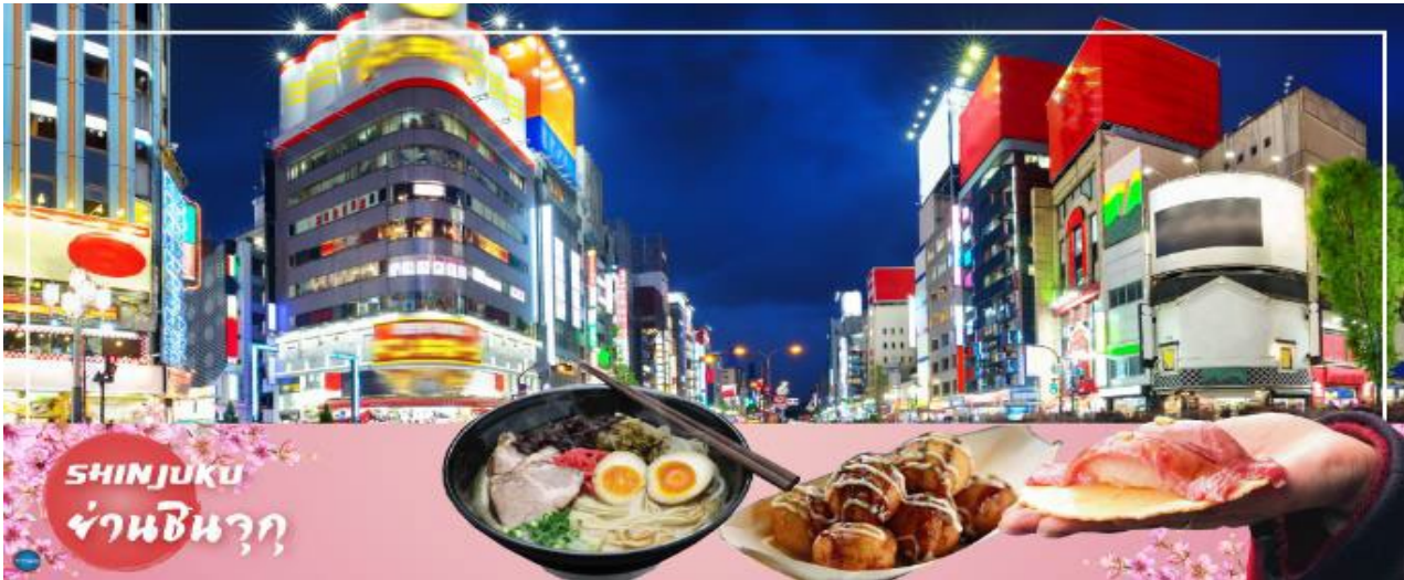
SHINJUKU ย่านชินจุกุ

นำท่านช้อปปิ้ง ย่านชินจุกุ (Shinjuku) (ใช้เวลาเดินทางประมาณ 40 นาที) ให้ท่านอิสระและเพลิดเพลินกับการช้อปปิ้งสินค้ามากมายทั้งเครื่องใช้ไฟฟ้า กล้องถ่ายรูปดิจิทัล นาฬิกา เครื่องเล่นเกม หรือสินค้าที่จะเอาใจคุณผู้หญิงด้วย กระเป๋า รองเท้า เสื้อผ้า แบรินด์เนม เสื้อผ้าแฟชั่นสำหรับวัยรุ่น เครื่องสำอางยี่ห้อดังของญี่ปุ่นไม่ว่าจะเป็น KOSE, KANEBO, SK II, SHISEDO และอื่นๆ อีกมากมาย ห้ามพลาด!!! จุดเช็คอินแห่งใหม่ของชาวโซเชียล นั่นก็คือ แมวยักษ์ 3 มิติ ที่โผล่บนจอแอลอีดีมีขนาดมหึมา จอมความโด่งดังขนาด 154 ตารางเมตร (1,664 ตารางฟุต) เสียงที่ออกจากลำโพงคุณภาพเกรดดี ความละเอียดภาพระดับ 4K ถือเป็นเทคโนโลยีระดับสูง ที่ให้ภาพเสมือนจริงปรากฏเป็นภาพแมวเหมียวเดินเล่นไปมาอยู่เหนือกรุงโตเกียว นอกจากแมวยักษ์แล้วท่านยังสามารถรับชมโฆษณาต่างๆ ที่ถูกครีเอทให้เป็นภาพ 3 มิติผ่านจอแอลอีดีนี้ ไม่ว่าจะเป็นแพนด้า, รองเท้าไนกี้, น้องหมา Pompompurin, จานบิน UFO แม้แต่ หุ่นยนต์เครื่องดูดฝุ่น ท่านสามารถรับชมและเก็บภาพได้ตามอัธยาศัย