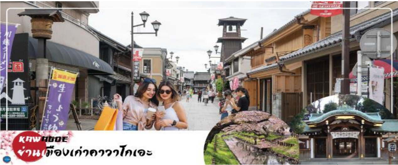
KAWAHOJE ย่านเทืองเก๋อวาโกเอะ

จากนั้นนำท่านขอพรความรัก ณ ศาลเจ้าฮิคาวะ (Hikawa Shrine) เป็นศาลเจ้าที่เชื่อว่าเด็ดยกเรื่องขอพรความรัก ภายในมี "อุโมงค์เฮอร์" เฮอร์ คือ แผ่นไม้ที่เราเขียนขอพร และนำมาผูกจนกลายเป็นช่อดอกไม้อุโมงค์ เป็นจุดที่นักท่องเที่ยวนิยมถ่ายรูปทำคอนเทนต์จำนวนมาก นอกจากนี้สายลมไม่ควรพลาด ท่านยังสามารถซื้อเครื่องรางต่างๆ ที่ไม่ใช่เฉพาะด้านความรัก ยังมี ด้านสุขภาพ ด้านการเงิน การงาน การเรียน เดินทางปลอดภัย และโชคลาภ ก็มีมากมายให้ท่านได้เลือกไว้เป็นของฝากของที่ระลึกอีกด้วย