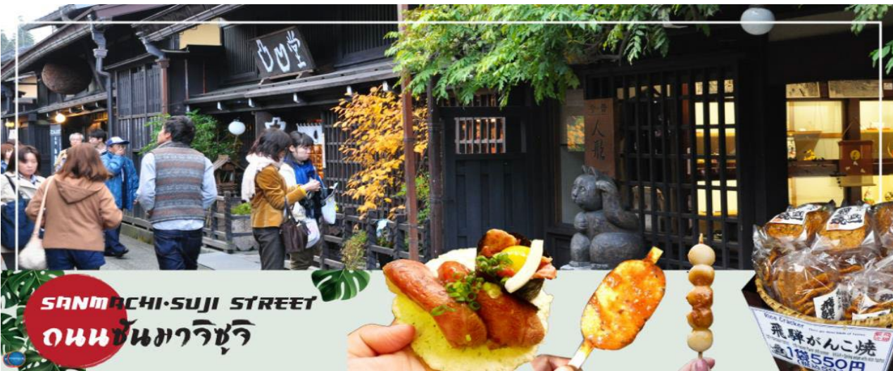
SANMACHI-SUJI STREET ถนนซันมาจิซุจิ

นำท่านเดินทางสู่ เมืองมัตสึโมโตะ (Matsumoto) เป็นเมืองที่ใหญ่เป็นอันดับสองของจังหวัดนากา