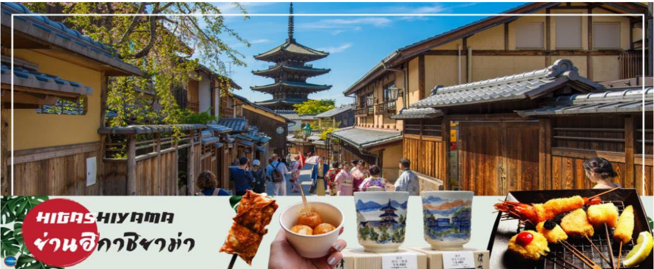
HIGASHIYAMA ย่านฮิกาชียามา

นำท่านสู่ วัดคิโยมิสึเดระ (Kiyomizu-dera) แปลเป็นภาษาไทยว่า วัดน้ำใส เป็นวัดที่มีชื่อเสียงที่สุดในเมืองเกียวโต สร้างขึ้นมาก่อนที่เกียวโตจะเป็นเมืองหลวงของญี่ปุ่น เมื่อปี ค.ศ.778 นักท่องเที่ยวนิยมเดินทางมาเพื่อสักการะและขอพรจากองค์พระโพธิสัตว์เจ้าแม่กวนอิม 11 พักตร์ 1000 กร ซึ่งเป็นพระประธานของวัด นอกจากนี้ที่นี่ยังเป็นที่ประดิษฐานของเทพเอบิสุผู้เป็นเทพเจ้าแห่งความร่ำรวยมั่งคั่ง ตัววัดก่อสร้างด้วยไม้เกือบทั้งหมดแต่ที่นาสนใจ ได้แก่ เสาที่ค้ำยันระเบียงวัดขนาดใหญ่ เสาดังกล่าวประกอบไปด้วยเสาไม้ขนาดใหญ่จำนวนร้อยกว่าต้น สร้างขึ้นด้วยไม้ขนาดใหญ่สูงจากพื้น 12 เมตร โดยไม้ใช้ตะปูแม้แต่ตัวเดียว อาคารไม้หลังนี้ได้รับการขึ้นทะเบียนเป็นมรดกโลกทางวัฒนธรรมในปี 1994 จากองค์การยูเนสโกในฐานะส่วนหนึ่งของอนุสาวรีย์ทางประวัติศาสตร์เมืองเกียวโต