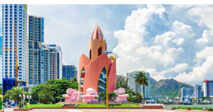
Tram Huong Tower