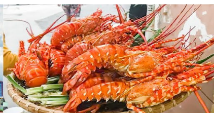
Nha Trang Night Market

*ทางบริษัทฯ ขอสงวนสิทธิ์ในการสลับโปรแกรมทัวร์ตามความเหมาะสมขึ้นอยู่กับสถานการณ์หน้างาน โดยคำนึงถึงผลประโยชน์ของลูกค้าเป็นสำคัญ