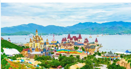
VinWonders NHA TRANG