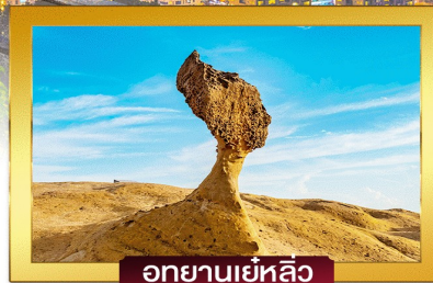
อุทยานเย่หลิว