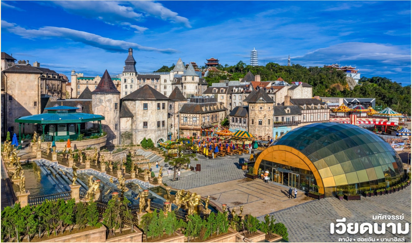
บัทจอร์รี่ เวียดนาม ดาบิง • ฮอยอัน • บานาฮิลล์

นำท่านชม สะพานสีทอง สถานที่ท่องเที่ยวใหม่ล่าสุดตั้งโดดเด่นเป็นเอกลักษณ์อย่างสวยงาม บนเขาบานาฮิลล์ นำท่านสู่จุดที่สร้างความตื่นเต้นให้นักท่องเที่ยวมองดูอย่างอึ้งการที่ซึ่งเต็มไปด้วยเสน่ห์แห่งตำนานและจินตนาการของการผจญภัยที่ สวนสนุก The Fantasy Park (รวมค่าเครื่องเล่นบนสวนสนุก ยกเว้น ฟันซีมิ่ง