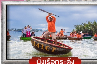
นั่งเรือกระดิง