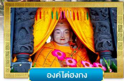
องค์ไต๋องกง