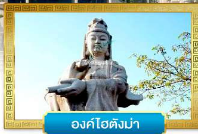
องค์โฮตังมา