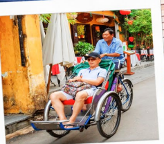
รถสามล้อ Cyclo