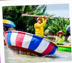
เรือกระดัง