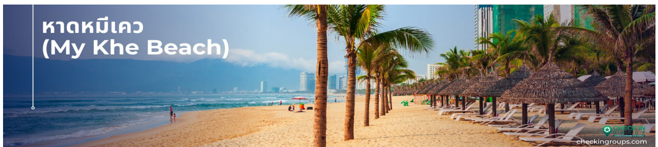
หาดหมีเคว (My Khe Beach)

นำท่านถ่ายรูปกับ หาดหมีเคว (My Khe Beach) ซึ่งเป็นหาดที่สวยงามที่สุดของดานังก็ว่าได้ หาดหมีเควมีแนวชายหาดกว้างขวาง และมีความยาวถึง 10 กิโลเมตร ทรายที่นี้ชาวละเอียด เดินแล้วนุ่มเท้ามากๆ มีแนวแก้อัชชายหาดที่หลังคามุงด้วยจากตั้งเรียงรายสามารถนอน