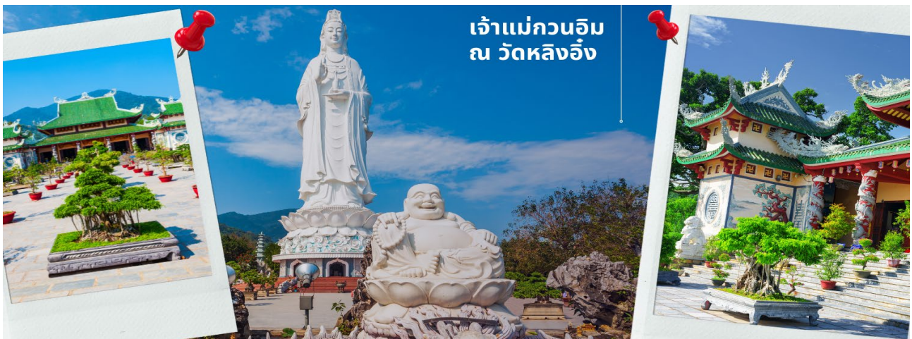
เจ้าแม่กวนอิม ณ วัดหลิงอิ่ง

นำท่านมัศจรรย์ใจ เจ้าแม่กวนอิม ณ วัดหลิงอิ่ง อยู่บนเกาะเซินตรา (Son Tra) ทางเหนือของเมืองดานัง เป็นวัดใหญ่ที่สุดของที่นี่ รูปปั้นปูนขาวของเจ้าแม่กวนอิมยืนหันหลังให้ภูเขา หันหน้าออกสู่ทะเลเพื่อเป็นการปกป้องคุ้มครองชาวประมงที่ออกไปหาปลา เสียงระฆังวัดที่ตีประสานกับเสียงคลื่นนั้นช่วยให้ชาวเรือรู้สึกสงบ และสร้างขวัญกำลังใจอย่างดีเยี่ยม และเป็นที่เคารพนับถือของคนดานัง