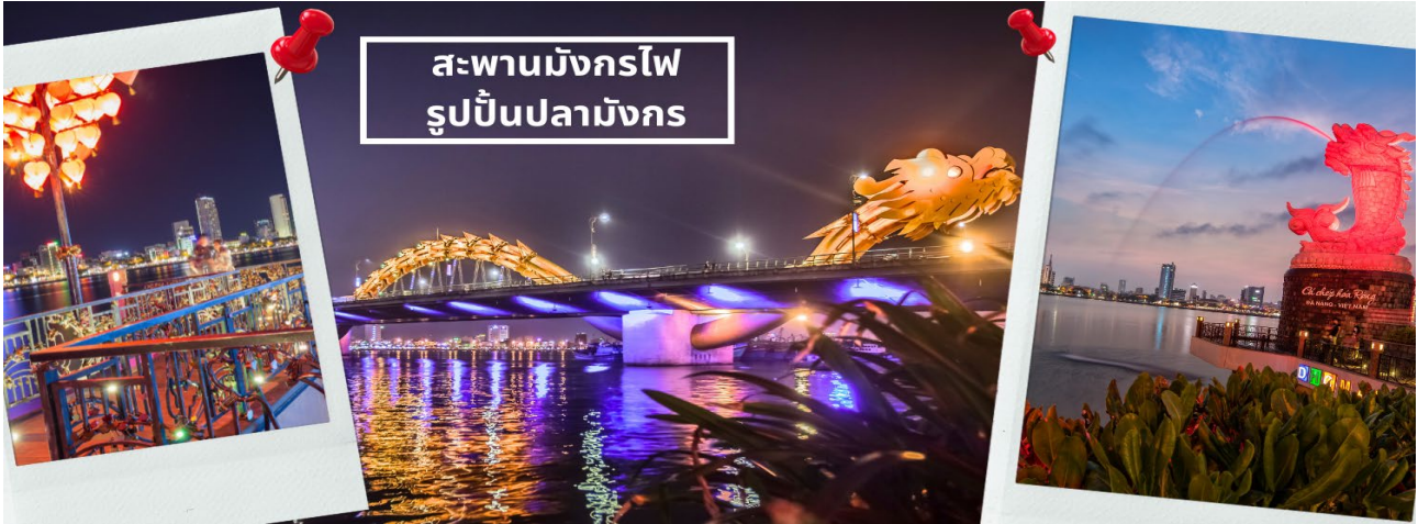
สะพานมังกรไฟ รูปปั้นปลามังกร

จากนั้นนำท่านชม สะพานแห่งความรัก ที่นิยมของหนุ่มสาวคู่รักกันมาซื้อกุญแจใส่คล้องใส่สะพาน จากนั้นนำท่านชม รูปปั้นปลามังกร ที่เป็นสัญลักษณ์ของเมืองดานัง เมืองที่กำลังจากปลากลายเป็นมังกร ในระยะใกล้ เชิญท่านเพลิดเพลินกับความอลังการของ สะพานมังกรไฟ ที่มีความยาวถึง 666 เมตร เป็นสะพาน 6 เลนส์ ซึ่งเป็นสะพานที่ตระการตามากที่สุดของเวียดนามในเวลานี้โดยการแสดงนี้จะเริ่มเวลา 21.00น. ของวันเสาร์และอาทิตย์เท่านั้น