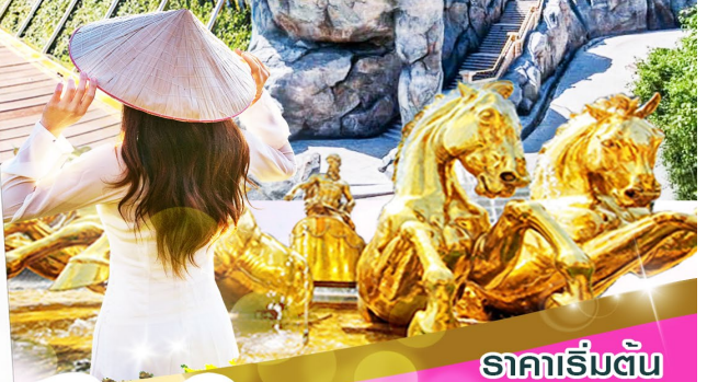
ราคาเริ่มต้น