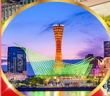
เมืองโกเบ