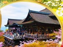
วัดคิโยมิจิ