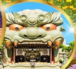
ศาลเจ้ามิมะ ยาชากะ