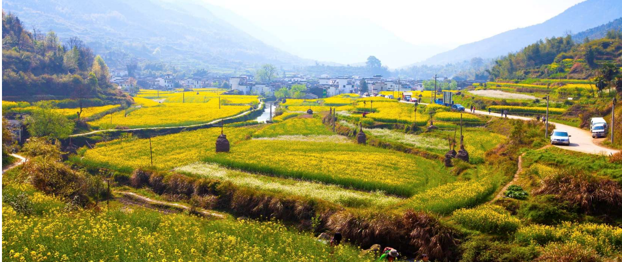
T2G-CSX04VZ ภูเขาเทวดาวังเขียนภู่อู๋หยวน หนานซาง ฉางซา 5D 4N (VZ) ไม่ลงร้านรัฐบาล