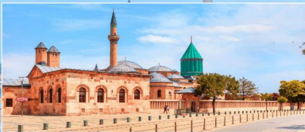
พิพิธภัณฑ์เมฟลานา KONYA