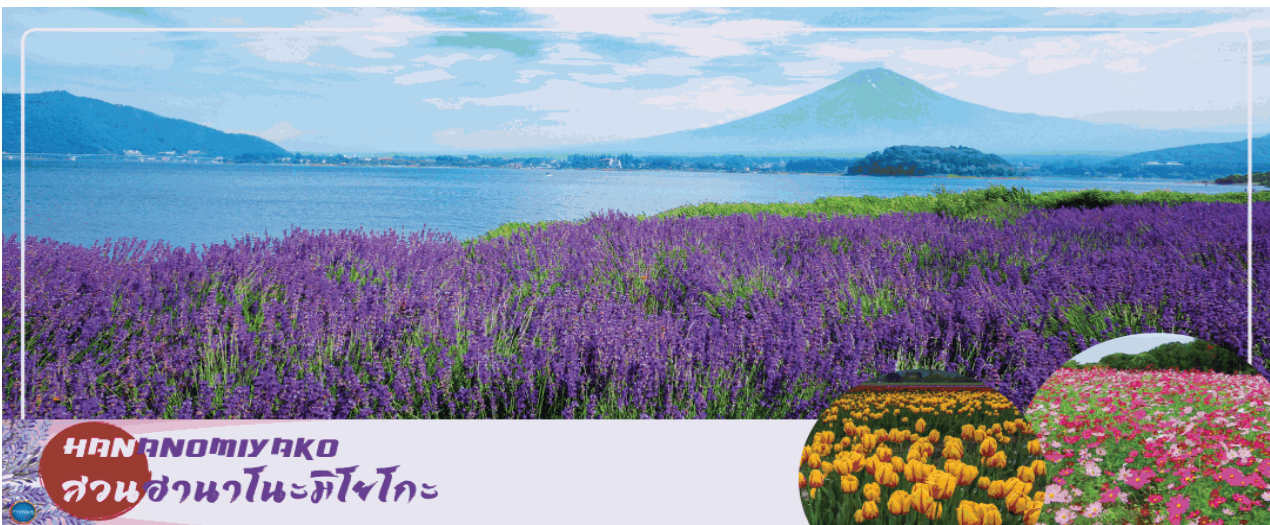
HANANOMIYAKO สวนฮานานะโนะมียากะ

ได้เวลาอันสมควรนำท่านเดินทางสู่จังหวัดยามานาชิ (ใช้เวลาเดินทางประมาณ 2.40 ชั่วโมง)