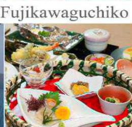
Yukari No Mori Fujikawaguchiko