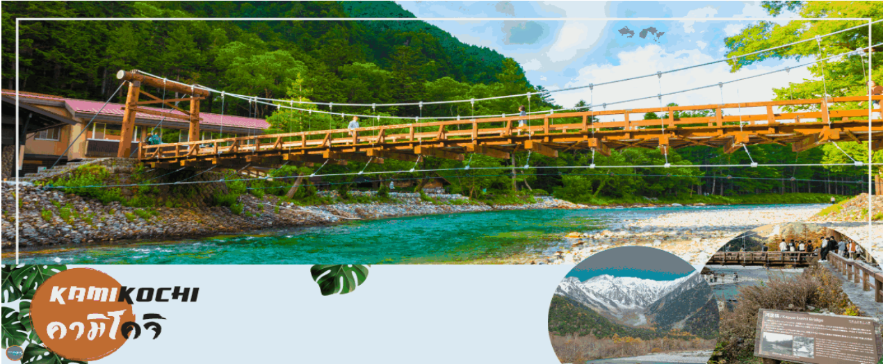
KAMIKOCHI คามิโคจิ

เมืองมัตสึโมโตะ - เมืองนากาโนะ - คามิโคจิ - สะพานกัปปะ - เมืองยามานาชิ - สวนดอกไม้सानะโนะมียากะ หรือ เทศกาลชมดอกลาเวนเดอร์ที่ทะเลสาบคาวากุจิ (ตามฤดูกาล) - หมู่บ้านโอชิโนะฮักไก - ออนเซ็น + ชาบูยักษ์